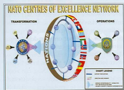
NATO centres of excellence network

Sinds november 2004 ben ik werkzaam als projectofficier voor de oprichting van het NATO C2 Centre of Excellence. In dit artikel wil ik u de aanloop en huidige status van deze plannen toelichten. Nederland heeft deze internationale ambitie in het kader van NATO Network Enabled Capabilities eind 2003 uitgesproken, en het wordt de hoogste tijd om dit concreet in te vullen. NATO rekent op onze nationale invulling, maar u begrijpt natuurlijk dat de invulling van nieuwe ambities in onze steeds maar krimpende organisatie geen eenvoudige opgave is. Maar een uitdaging is het zeker.